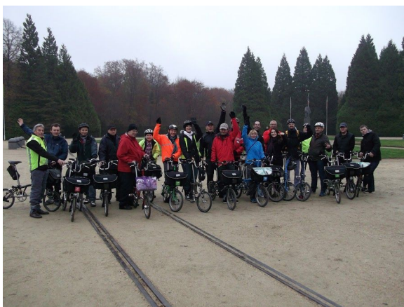
Clairière de l'Armistice

Départ à 10h15 à la gare de Compiègne. La journaliste du Courrier picard prend une photo qui sera publiée dans l'édition du 19-11 (l'article se résumant à sa plus simple expression aux deux lignes sous la photo...). La piste cyclable N° 6 nous mène à la Clairière de l'Armistice où nous faisons une pause. Ensuite nous poursuivons notre route par la nouvelle piste cyclable jusqu'au carrefour des Loups, où nous pénétrons au cœur de la forêt domaniale par une route vallonnée, jusqu'au carrefour de Caborne. La route forestière des Prés (très pentue) conduit au panorama des Beaux Monts, un des plus beaux points de vue de la forêt (dommage que le temps était brumeux). La descente de la colline se fait sur la route forestière en lacets rendue très glissante à cause des feuilles, ce qui impose la prudence.