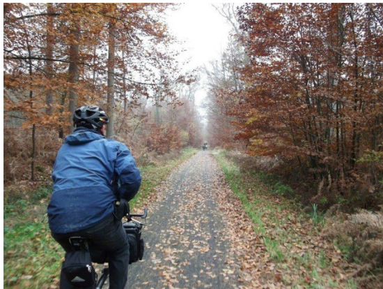
Piste cyclable Pierrefonds – St-Jean-aux-Bois

Nous faisons un crochet pour aller voir le 'Chêne sous St-Pierre', un des arbres multi centenaire les plus remarquables de la forêt. La piste nous conduit à Pierrefonds, où nous déjeunons à la brasserie 'Le Kiosque'. Après le repas nous découvrons le château féodal sur les hauteurs de Pierrefonds, et faisons le tour du parc à vélo avant de prendre le chemin du retour vers Compiègne par la piste cyclable N° 2 par Saint-Jean-aux-Bois, village classé monument historique. A l'arrivée à Compiègne, un petit crochet dans le parc du palais impérial permet de terminer cette balade conviviale avant de nous séparer à la gare SNCF après avoir pris un verre à la brasserie.