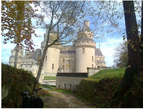
Château de Pierrefonds

Nous faisons un crochet pour aller voir le 'Chêne sous St-Pierre', un des arbres multi centenaire les plus remarquables de la forêt. La piste nous conduit à Pierrefonds, où nous déjeunons à la brasserie 'Le Kiosque'. Après le repas nous découvrons le château féodal sur les hauteurs de Pierrefonds, et faisons le tour du parc à vélo avant de prendre le chemin du retour vers Compiègne par la piste cyclable N° 2 par Saint-Jean-aux-Bois, village classé monument historique. A l'arrivée à Compiègne, un petit crochet dans le parc du palais impérial permet de terminer cette balade conviviale avant de nous séparer à la gare SNCF après avoir pris un verre à la brasserie.